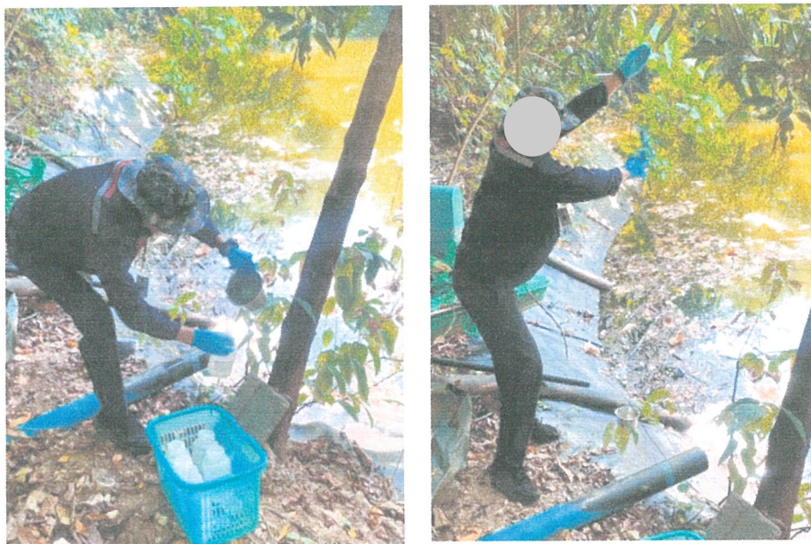
รูปภาพที่ 3.1 การเก็บตัวอย่างน้ำผ่านการบำบัด

การตรวจวิเคราะห์คุณภาพน้ำของโครงการ โรงแรม ศรีพันวา บูทีค รีสอร์ท แอนด์ สปา ในระยะดำเนินการ ประจำเดือนมกราคม-มิถุนายน 2566 คือ น้ำผ่านการบำบัดและน้ำทะเล แสดงดังรูปภาพที่ 3.1 การเก็บตัวอย่างน้ำผ่านการบำบัด